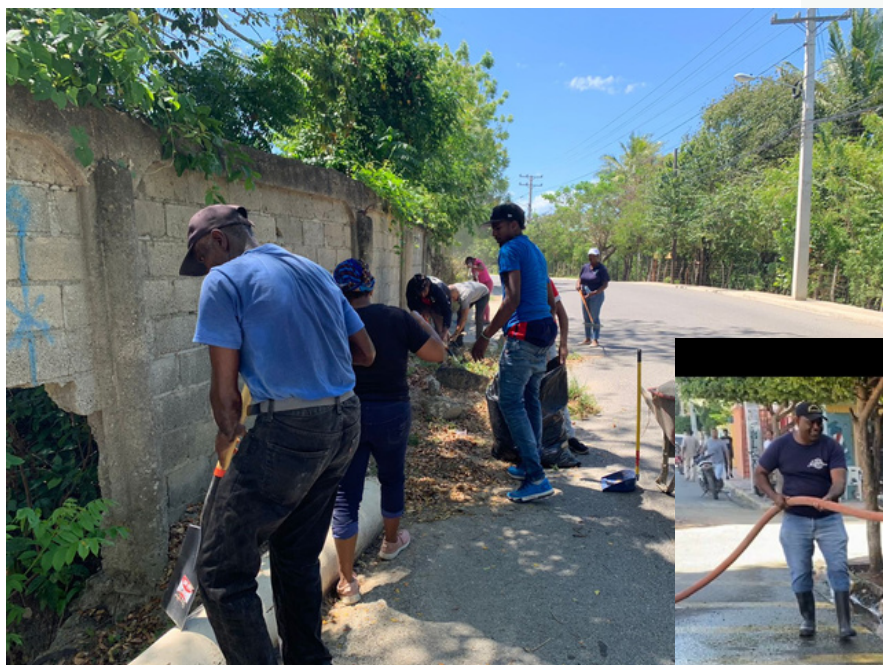
AYUNTAMIENTO MUNICIPAL DE LUPERON